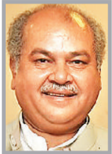
शासन प्रणाली नरेंद्र सिंह तोमर

लोकतंत्र शासन में जनता का बहुमत पाकर सत्ता पक्ष शासन के सूत्र संभालता है और विपक्ष निगरानीकर्ता की भूमिका में सरकार से सवाल करता है। भारतीय गणतंत्र की बीते 76 वर्ष की अवधि में संसद कई तरह की घटनाओं की साक्षी रही है। हमारी आस्था के केंद्र वरिष्ठ नेताओं की तीखी बहसें, आरोप-प्रत्यारोप, विरोध और असहमतियों के लंबे विमर्श लोकसभा और राज्यसभा के गौरवशाली अतीत में दर्ज हैं। कुछ अप्रिय घटनाक्रम भी हुए, लेकिन नियमों और मान्य परंपराओं की मर्यादाओं को कभी जानबूझ कर ओझल नहीं होने दिया गया। विपक्ष के अमर्यादित व्यवहार के समक्ष लोकसभा अध्यक्ष ओम बिरला का कार्यकाल प्रेरणा, उम्मीद और आश्वस्तिकता का पर्याय बन गया है।