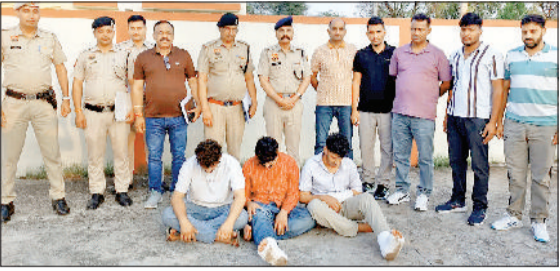
लोहारू। फिरौती मांगने वाले तीनों आरोपी पुलिस टीम की गिरफ्त में।

निकटवर्ती राजस्थान के झुंझुनू जिले से फॉर्च्यूनर गाड़ी सहित एक व्यापारी और गाड़ी चालक को अगवा कर लिया गया। उनके परिजनों से व्हाट्सएप कॉल करके 20 रुपये की फिरौती मांगने के इस सनसनीखेज मामले में लोहारू डिटेक्टिव स्टाफ की टीम की मुस्तैदी काम आई और पुलिस टीम ने तीन बदमाशों को काबू कर लिया। उनके कब्जे से अगवा किए दोनों पीड़ितों को भी सफुशल छुड़वा लिया गया। पुलिस ने तीनों आरोपियों के कब्जे से एक अवैध पिस्तौल, मैगजीन और तीन कारतूस सहित नकदी भी बरामद की है। शुक्रवार सायं को डीएस्पी