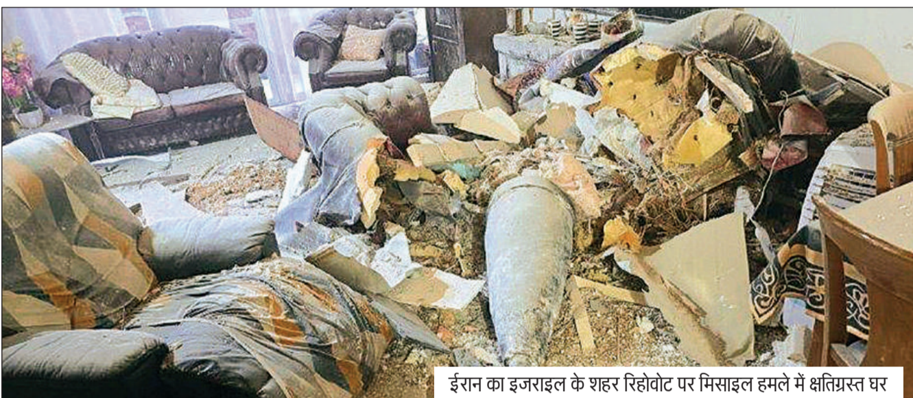
ईरान का इजराइल के शहर रिहोवोट पर मिसाइल हमले में क्षतिग्रस्त घर